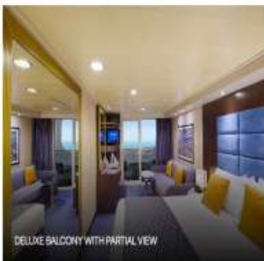
DELUXE BALCONY WITH PARTIAL VIEW