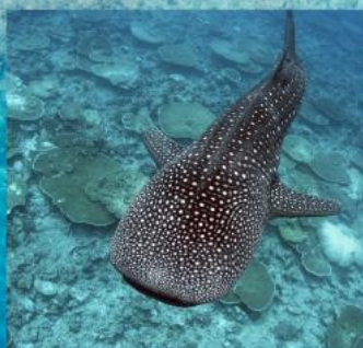
Whale Shark Snorkeling