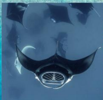
Manta Ray Snorkeling